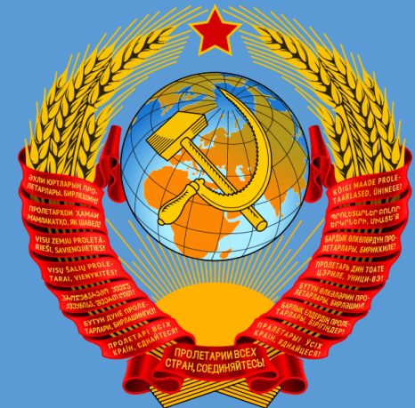
نشان اتحاد جماهير شوروى